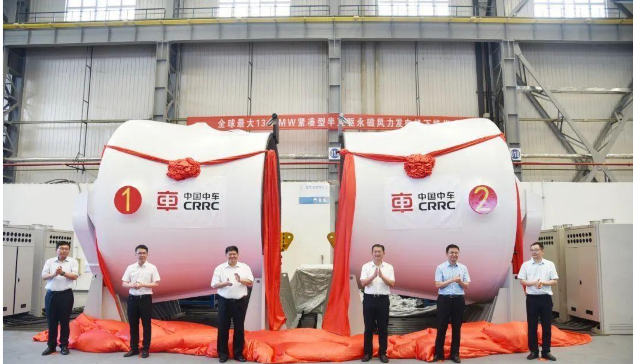
可以选用中国中车13.1MW紧凑型半直驱永磁风力发电机